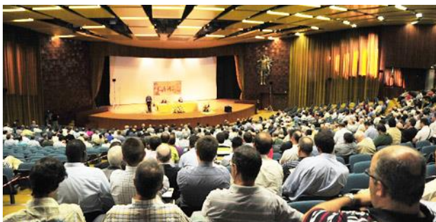
Anfiteatro do Centro Pastoral Paulo VI

Dia 5 de Maio – Acolhimento a partir das 09:00