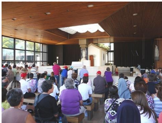
Capelinha das Aparições