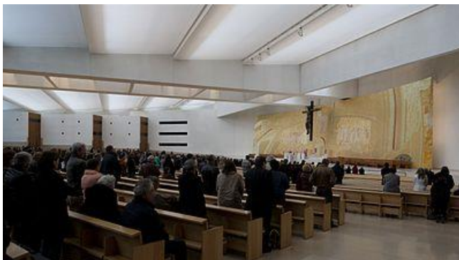
Basílica da Santíssima Trindade

17h30 – Rollo-rollo – “Amizade, confiança e os afastados”