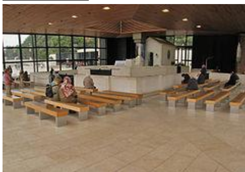
Capelinha das Aparições

Dia 4 de Maio – 17:00 Eucaristia celebrativa do centenário do nascimento de Eduardo Bonnin–