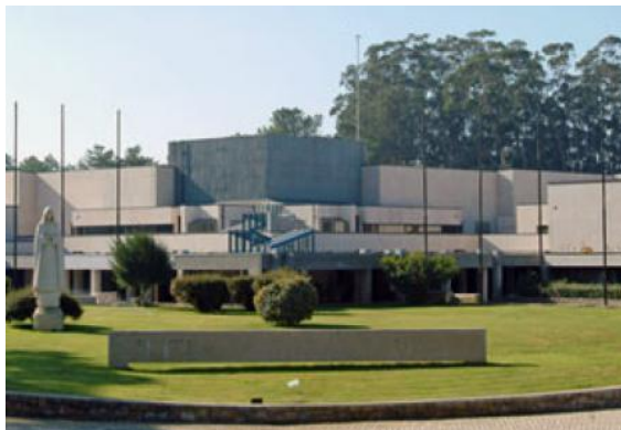
Centro Pastoral Paulo VI