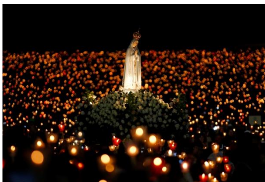
Recinto do Santuário